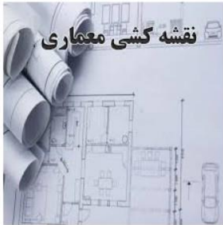
نقشه کشی معماری